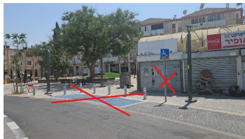
סימון חניה כולל העתקת עמוד.

11. בקשה עש רדה בימר- גיבורי ישראל 16 מהות הבקשה אושר וסומן למבקש חנייה נכים על שמו. התושב מבקש לשנות את מיקום החנייה ולסמן אותה קרוב יותר לכניסה של הבית, בטענה שהחנייה הנוכחית רחוקה עבורו ואינה נותנת מענה מספק למגבלותיו. החלטה הוועדה בחנה את הבקשה והחליטה לאשר את הבקשה. ההחלטה התקבלה פה אחד. עדכון מיום 08/06/05 נערך סיור ע"י יו"ר הוועדה ומיכאל. אושר סימון חניית נכים כאמור: ביטול חניה קיימת כולל עמוד.